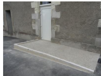
Création d'une rampe d'accès à la cantine

L'enveloppe budgétaire pour la mise en accessibilité des bâtiments communaux est de 44 000 €.